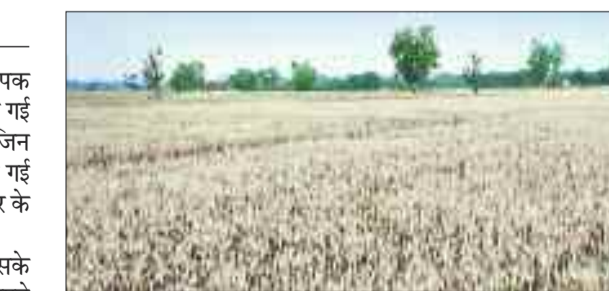
पक्कर तैयार गेहूं की फसल।

अभी गर्मी दिनों दिन बढ़ रही है, इसके कारण ग्रामीण परिवार सुबह होने पर अपने खेतों में गेहूं की कटाई करने पहुंच जाते हैं और कुछ घंटों तक कटाई करते हैं। और धूल अधिक तीखी हो जाती है, तब अपने घर लौट जाते हैं, इसके बाद अपराह्न बाद फिर से खेतों में गेहूं की कटाई करने पहुंचते हैं तथा शाम ढलने तक खेतों में गेहूं की कटाई कार्य में जुटे रहते हैं। जानकारी के अनुसार