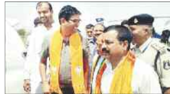
एमसीबी पहुंचे वित्तमंत्री ओपी चौधरी।

विद्यालयों में वार्षिक परीक्षाएं संपन्न हो गई हैं, इसके बाद अब विद्यालयों में विद्यार्थियों की उपस्थिति नहीं के बराबर हो गई है। हाई एवं हायर सेकेंडरी विद्यालयों में भी विभिन्न कक्षाओं में विद्यार्थियों की उपस्थिति बेहद कम हो गई है। वहीं जिले में संचालित प्राथमिक एवं पूर्व माध्यमिक विद्यालयों में भी स्थिति ठीक नहीं है। प्राथमिक स्तर के विद्यालयों में भी गिनती के बच्चे पहुंच रहे हैं। हालत यह है कि जहां 50 से अधिक बच्चे जिन विद्यालयों में दर्ज हैं, उन विद्यालयों में दर्जन भर बच्चे ही मुश्किल से पहुंच रहे हैं। शिक्षकों के अनुसार बच्चों की कम उपस्थिति के बावजूद अधिक उपस्थिति लगाए जाने की भी शिकायत है।