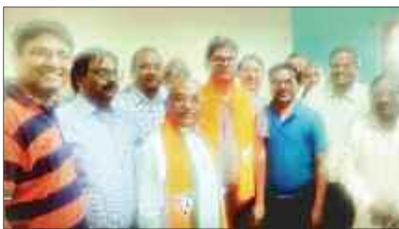
वित्तमंत्री से मुलाकात करते पदाधिकारी।

इस मौके पर सभी पदाधिकारियों ने वित्तमंत्री का साल ओढ़ाकर एवं पुष्पगुच्छ भेंट कर उनका स्वागत किया। इस अवसर पर वित्तमंत्री श्री चौधरी ने व्यापारियों